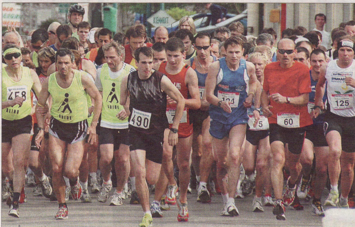
Auf die Plätze; fertig, los! Insgesamt 137 Starter finishen beim 10km-Hauptlauf im Rahmen des 13. Garser Straßenlaufes.